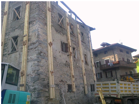
MESSA IN SICUREZZA