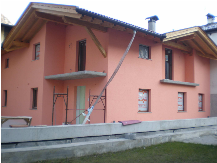
NUOVO EDIFICIO IN PROVINCIA DI TRENTO