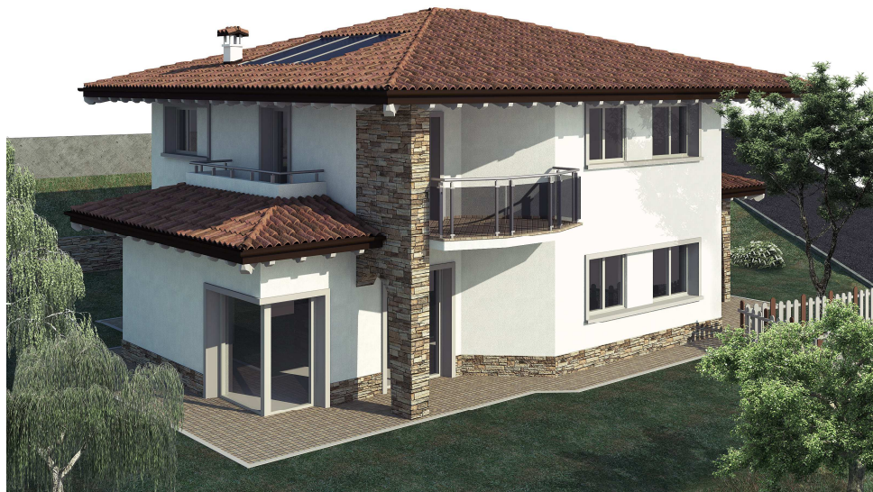
RENDER – NUOVO EDIFICIO IN CORSO DI COSTRUZIONE