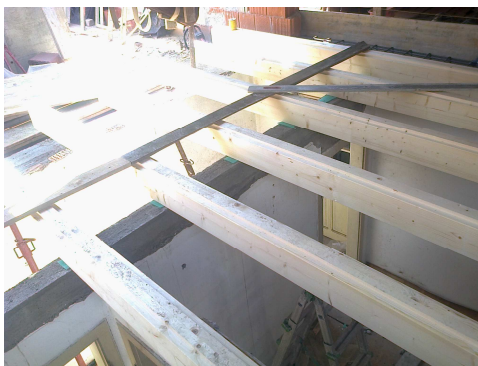
NUOVI SOLAI IN LEGNO