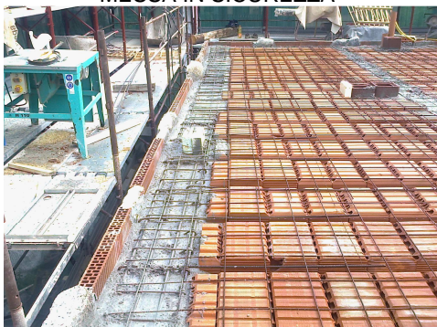
NUOVI SOLAI LATEROCEMENTIZI